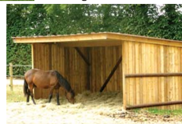
Abris et box de chevaux