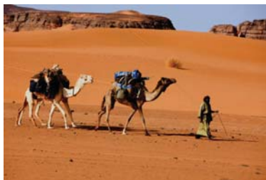
Nomadism & journey