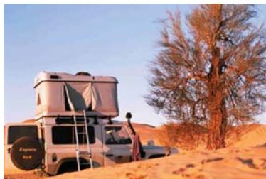
Mountain and remote areas