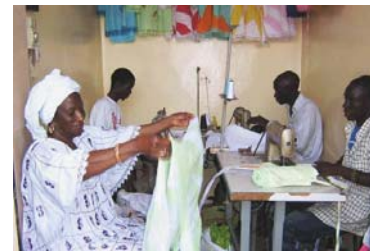
Ateliers et boutiques