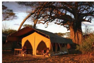
Lodges & shelters